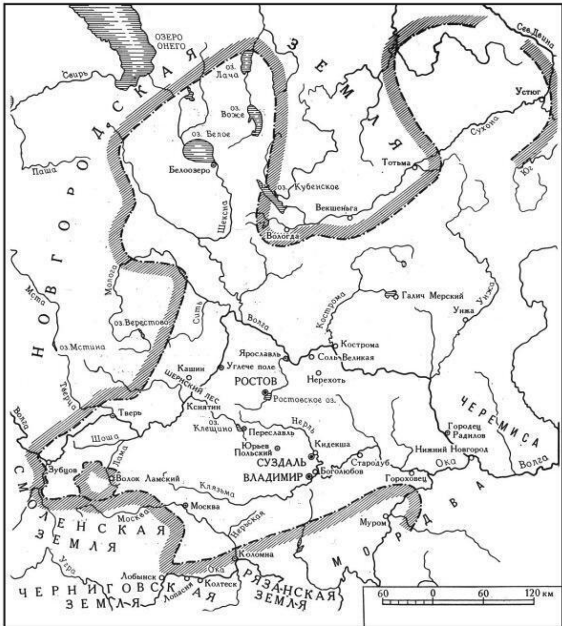
Владими́ро-Сузда́льское княжество во второй половине XII – начале XIII века

Пребывание княжеской семьи в Суздале объяснялось тем, что здесь строилась новая деревянная крепость. «Того же лета заложен был град Суздаль, и срублен был того же лета», – сообщает летописец сразу после известия о «постригах» Юрия. А месяц спустя княжеское семейство находилось уже в стольном Владимире: