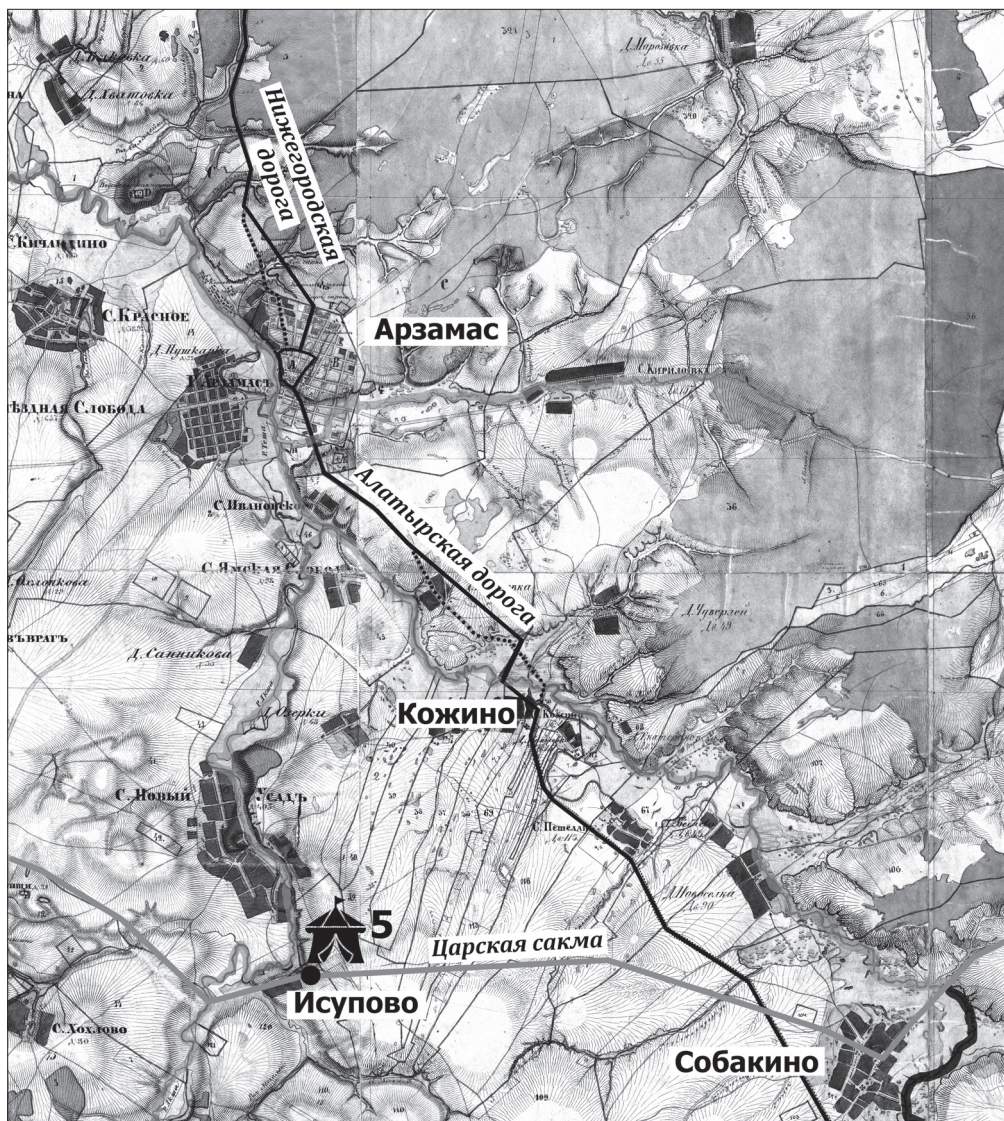
Иллюстрация II. Прохождение сакмы относительно Арзамаса

Фрагмент топографической межевой карты Нижегородской губернии А. И. Менде 1850 года. Поверх карты нанесена дорога от реки Алатырь в Нижний Новгород по маршруту конца XVIII века с планов генерального межевания, пунктиром отмечены изменения дороги к середине XIX века. Можно обратить внимание, что в районе Кожино на этой дороге существовал резкий поворот в связи с тем, что в тех местах был разлив Тешы и существовали водоемы; также с севера дорога конца XVIII века заходила в город слегка восточнее. Следует отметить, что после основания Арзамаса дорога, уходящая на юг от него, называлась Алатырской, а на север — Нижегородской. Также показан маршрут Царской сакмы и место пятого стана Иоанна Грозного в 1552 году.